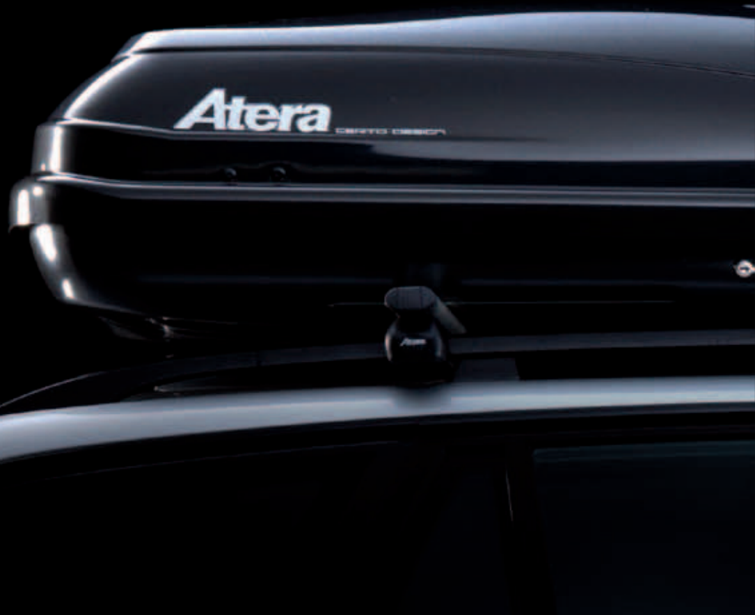
Abb. b 37,50€

ART.NR.: 082 195 Ideal für die Unterbringung der Dachbox, z.B. in einer Garage. Einfache Montage.